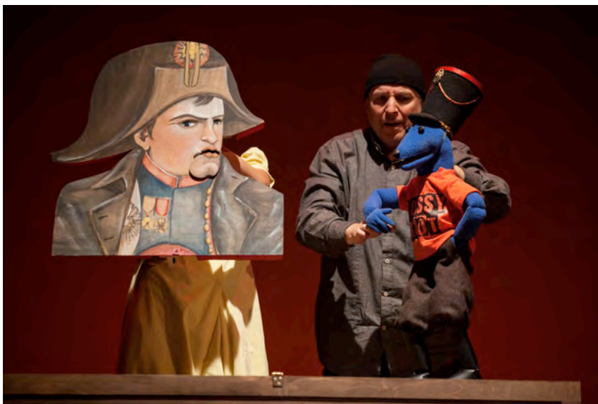
Illustration 2 : Guerre et paix : Loup bleu, aide de camp de Napoléon.

Sur les caisses apparaîtront les figures historiques : bustes en 2D de Napoléon et du général Koutouzov. La page de manuel fixe le portrait des grands hommes, figures à retenir dans les marges. Dans la mise en scène, ces formes animées sont comme figées dans leurs mouvements par l'histoire (voir illustrations 2 et 3).