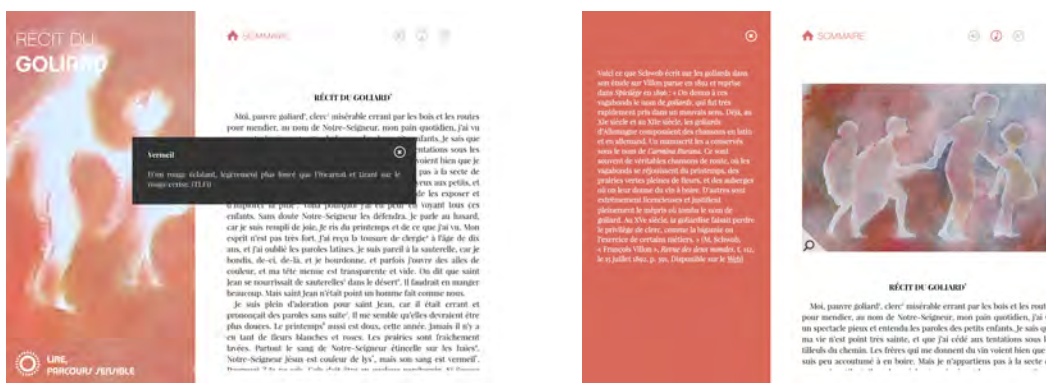
Illustration 7 : Affichage des notes lexicales en pop-up et des notes contextuelles en marge (extraits de l’édition enrichie)

Une des hypothèses de départ de notre publication est que le lecteur sera amené à s’intéresser aux notes éclairant le texte si ces dernières ne s’imposent pas directement à lui, mais demeurent adaptables à son besoin d’information. Le lecteur peut même choisir le type de notes qu’il souhaite activer grâce à la distinction entre les appels des notes lexicales et ceux des notes contextuelles 10 . L’objectif est alors de participer à une démocratisation de la consultation des notes en agissant sur leur forme, leur présence et leur positionnement. Cette hypothèse demandera à être vérifiée par des enquêtes de réception 11 .