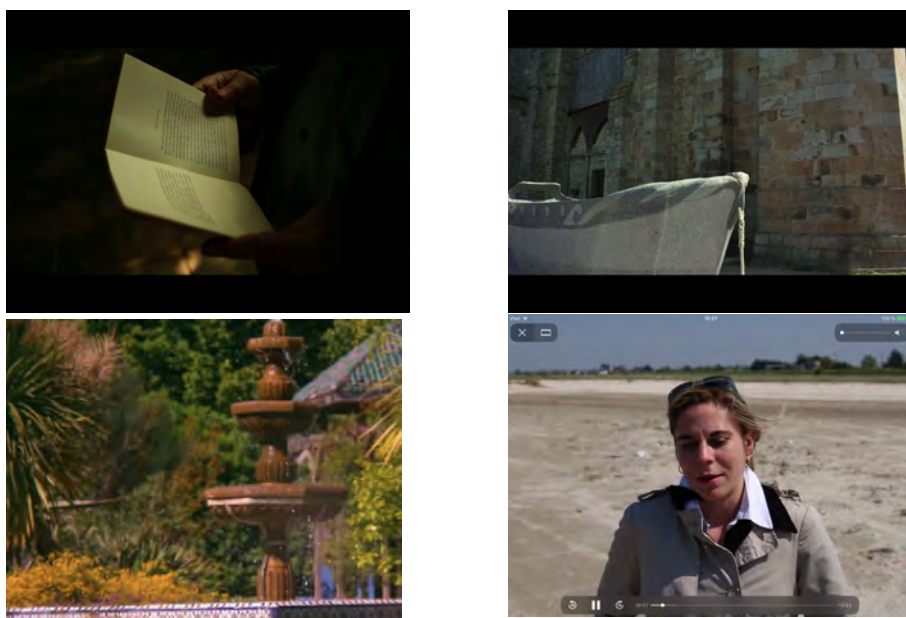
Illustration 6 : Captures de vidéos extraites de l'édition enrichie de La Croisade des enfants (entretiens avec des spécialistes de littérature médiévale)