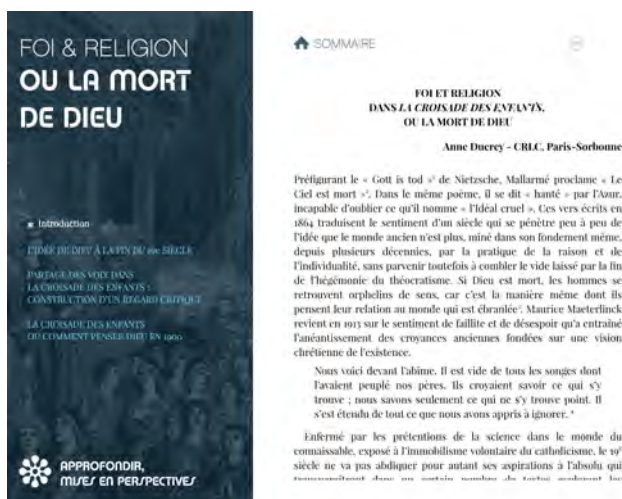
Illustration 5 : Parcours « Approfondir, mise en perspective » (extrait de l'édition enrichie)

Le troisième parcours invite à une démarche d'approfondissement par la découverte du point de vue de chercheurs spécialistes de différents domaines et périodes, à travers des articles enrichis d'illustrations et de sons, mais aussi d'interviews vidéos. Ces détours, étayages ou expansions scientifiques ne sont pas opposés au plaisir de la mise en scène, au jeu avec les sons, les images et la sémiotique générale de l'outil.