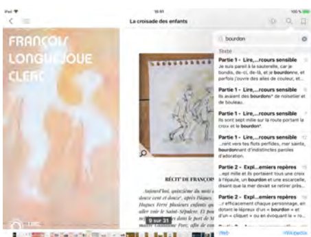
Illustration 10 : Fonctionnalité de recherche plein texte (extrait de l'édition enrichie)

Enfin, la publication numérique facilite l'analyse des échos lexicaux, le développement de compétences d'analyse intratextuelle, grâce à la navigation via le sommaire, mais surtout la recherche plein texte qui permet de repérer les occurrences d'un mot. C'est particulièrement intéressant dans ce texte tissé de répétitions, qui ont différentes fonctions. Prenons ainsi l'exemple du mot « bourdonner » qui vient faire écho aux « bourdons » des pèlerins.