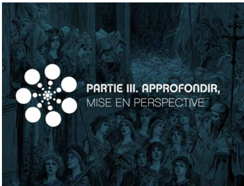
Illustration 8 : Logos des différents parcours (extraits de l'édition enrichie)

Les gestes nécessaires pour parcourir le livre ont été pensés dans cette même perspective : nous avons essayé de faire en sorte qu'ils soient assez intuitifs et cohérents, par exemple, grâce au défilement de l'écran ( scrolling ) présent dans toutes les pages, y compris dans les notes, et au geste de tourner des pages pour changer de chapitre. La notion de page, préservée avec le choix de l'ePub3 fixe, participe de la transition entre le papier et le numérique. Notre édition enrichie reprend des repères issus de l'imprimé (les pages qui se tournent, la linéarité), mais rappelle aussi la lecture Web (avec le scrolling , le bouton sommaire, l'interactivité, ou l'accès au texte via un nuage de tags). Cette transition d'une technologie à l'autre semble nécessaire à l'adaptation du lecteur. Elle était déjà nettement visible dans le passage du manuscrit à l'imprimé. Au début de l'imprimerie, les incunables gardaient des aspects formels du manuscrit en copiant les lettres gothiques et en conservant des éléments manuscrits pour faciliter le repérage dans le livre et éclairer le texte. De la même façon, le livre numérique enrichi, s'il s'émancipe du modèle homothétique, reste encore attaché à la structuration du livre papier, difficile à dépasser sans crainte de sortir de la notion de livre 12 .