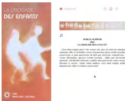
Illustration 9 : Captation vidéo montrant la continuité iconographique des chapitres (extrait de l'édition enrichie)

D'autre part, l'édition numérique peut encourager la perception et l'analyse de l'énonciation littéraire. On peut souligner l'intérêt de la lecture sonore sur ce plan : les voix incarnent les personnages, mais sans chercher à trop singulariser chacun d'entre eux, sans trop appuyer le trait. Ce choix correspond à l'écriture de Schwob, dans laquelle il y a à la fois une singularisation du discours de chaque protagoniste (le lépreux, le goliard, les enfants, les papes, le kalandar) et en même temps une certaine continuité, une homogénéité de l'ensemble des récits organisés de façon linéaire, structurée vers la fin du récit.