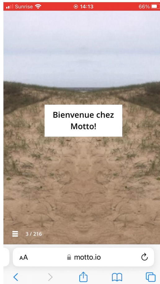
Figure 2. Capture d'écran de la page d'accueil, www.motto.io

caméra de son téléphone intelligent et de filmer ce qu'il y a autour de soi : l'œuvre emprunte au documentaire et à la fiction, construisant le fil de l'intrigue grâce aux séquences du public. Les captations vidéo durent deux secondes et sont intégrées à une banque de données qui sont récupérées par le logiciel et jouées tout au long de l'histoire.